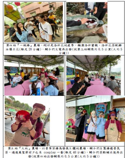
第四站「一級棒」農場,剛好是洛神花的產季,醃漬洛神蜜餞,洛神花茶配雞 油爆米花(駐足 20 分鐘)。騎士們先電再出發(從第二站騎我的 0.5 公里(大約 5 分鐘))