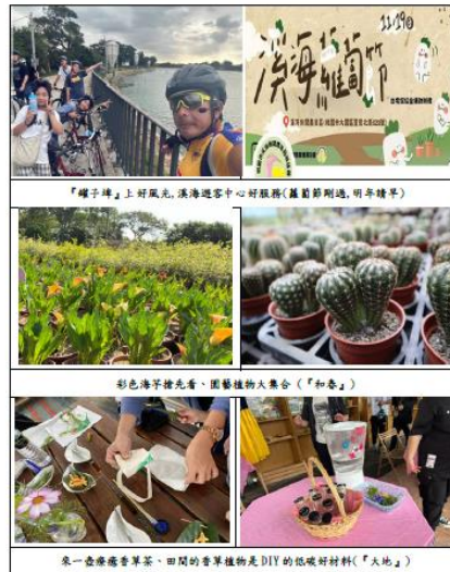
「罐子牌」上好風光,溪海遊客中心好服務(蘿蔔節剛過,明年續單)